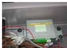
アイシン精機(株)豊頃試験場での実装車両(左)と搭載ECU(上)